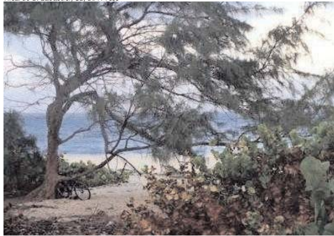
Barbados será palco do Dia Mundial do Meio Ambiente: risco de acabar