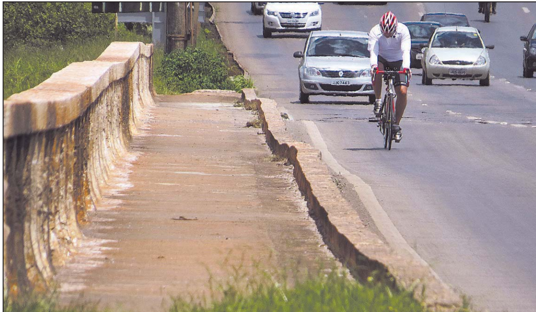
A parte de cima da ponte será totalmente substituída, e ciclistas terão uma via exclusiva para eles